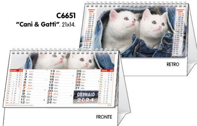
C6651 "Cani & Gatti". 21x14.