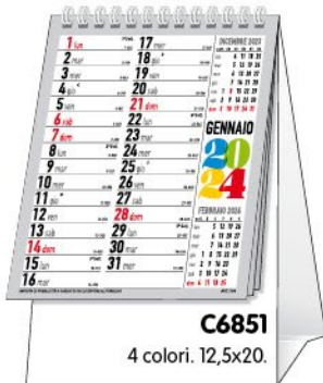
C6851 4 colori. 12,5x20.