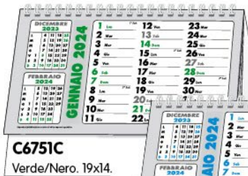
C6751C Verde/Nero. 19x14.