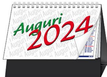
C6551N 2 colori. 16x14.