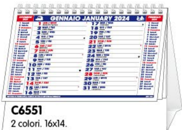
C6551 2 colori. 16x14.