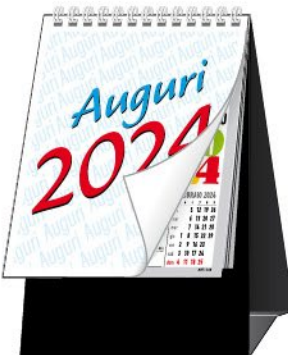
C6851N 4 colori. 12,5x20.