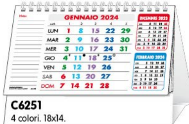
C6251 4 colori. 18x14.