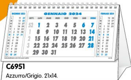
C6951 Azzurro/Grigio. 21x14.