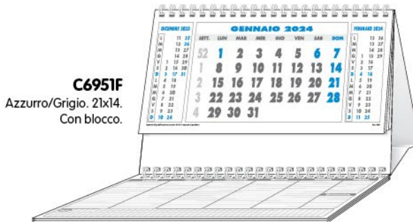
C6951F Azzurro/Grigio. 21x14. Con blocco.