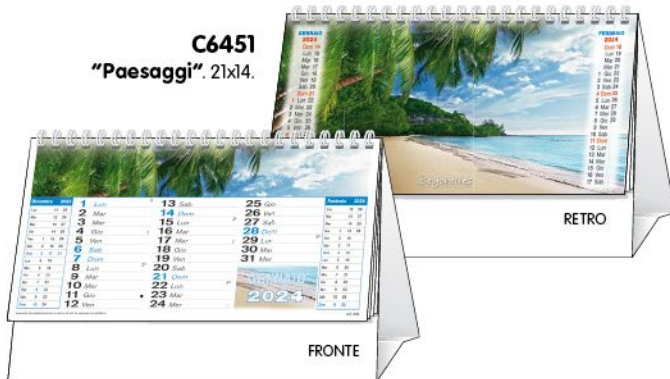
C6451 "Paesaggi". 21x14.