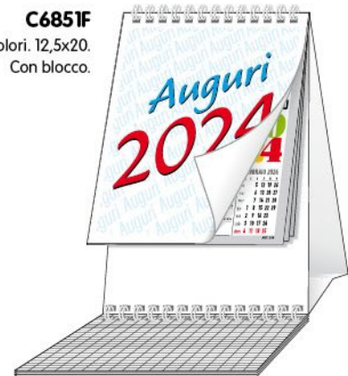
C6851F 4 colori. 12,5x20. Con blocco.